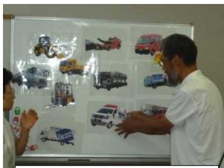
おもちゃ図書館のおがたのスタッフによるお楽しみ会