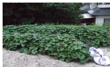
青々と茂ったイモづる

暑い、暑いとぼやきながらも、何とか猛暑の夏を乗り越えたような気がします。台風15号がもたらした大雨は確かに秋雨前線の影響で、秋が近づく気配が風の匂いで感じられるようです。きらら農園の夏野菜もそろそろ店じまい。保護者の方や職員のみなさんからたくさん買って頂きました。きらら一同、厚くお礼申し上げます。農園ではすでに冬野菜の芽が出始めました。大根、白菜、高菜を育て漬物に挑戦しようと思っています。11月にはサツマイモの収穫もできます。季節の野菜作りは毎日がワクワクです。